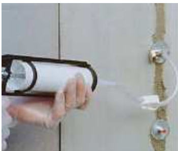
4. Injektointityö patruunapistoolilla mansettien avulla.